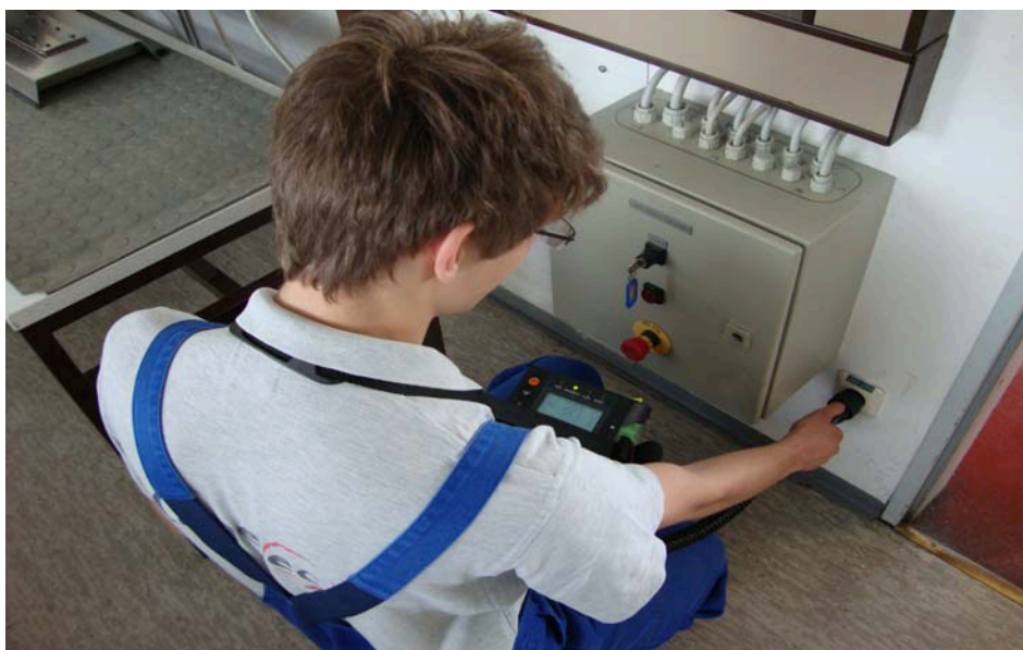
Messung an einem Unterverteiler